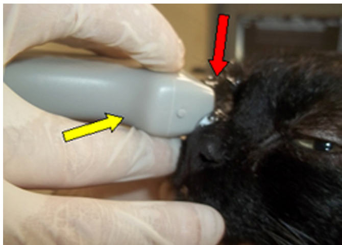
Fig.1. Imagem fotográfica de exame ultrassonográfico ocular em gato sem raça definida. Observa-se transdutor microlinier 9 MHz (seta amarela) em contato com o olho direito tendo por interface gel para ultrassonografia (seta vermelha).

te o exame. As imagens obtidas foram armazenadas para futura análise.